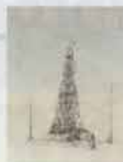
Omslagillustratie Ludwig Volbeda